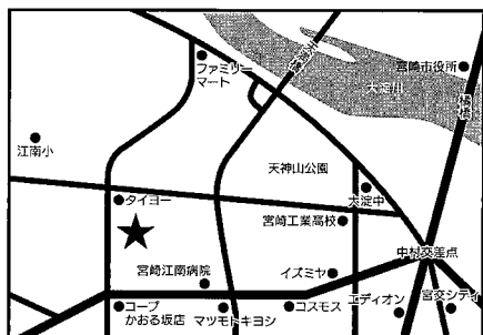
宮崎市民文化ホール イベントホール

企業の人材確保に関して、ご質問又お困りごとなどございましたら、ご自由に記入ください。