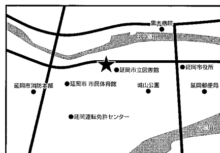
延岡市社会教育センター